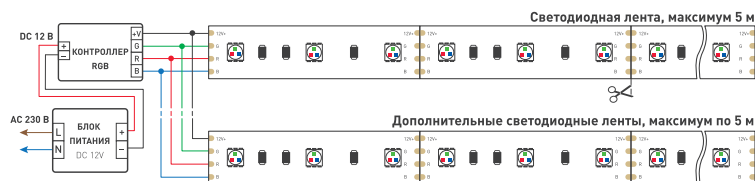
Черный провод — общий «+», красный провод — «R», зеленый провод — «G», синий провод — «B» Схема 1. Подключение нескольких светодиодных лент с одной стороны