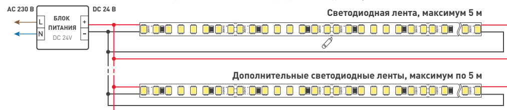
Схема 1. Подключение нескольких светодиодных лент с двух сторон